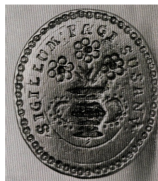
obr.3 pečatidlo s motívom hrnčiarstva