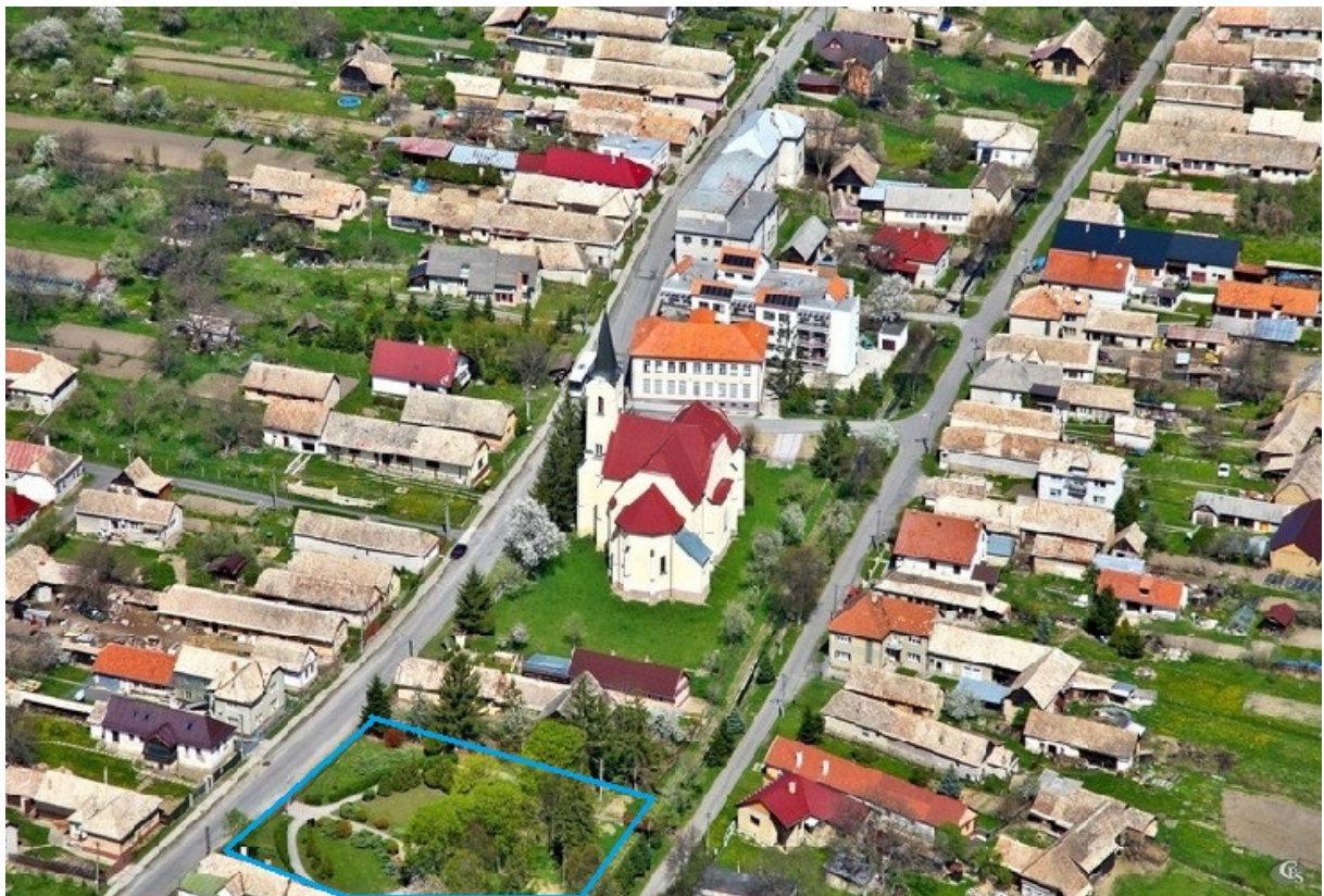
Obr.č.1 Sušany - pohľad z vtácej perspektívy.

Tvorba záhrad, parkov a celého zeleného priestoru v obývanom prostredí si vyžaduje ústretovosť a pochopenie všetkých obyvateľov, ktorý sa budú v danom priestore pohybovať a využívať ho vo voľnom ako aj pracovnom čase. Je to proces od nápadu (idea) cez projektovanie a realizáciu až po prevádzku a starostlivosť o dielo, ktoré je tu „pre ľudí od ľudí“ prepojené jednotnou myšlienkou danou na začiatku.